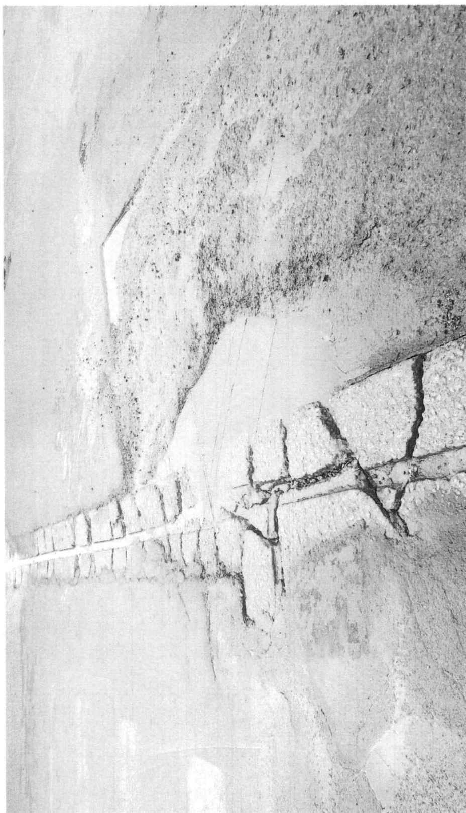
RECONSTRUÇÃO DE SARJETÃO NO CRUZAMENTO DA RUA THULLER COM A RUA DOM LUIS DE SOUZA, JARDIM UNIVERSO.