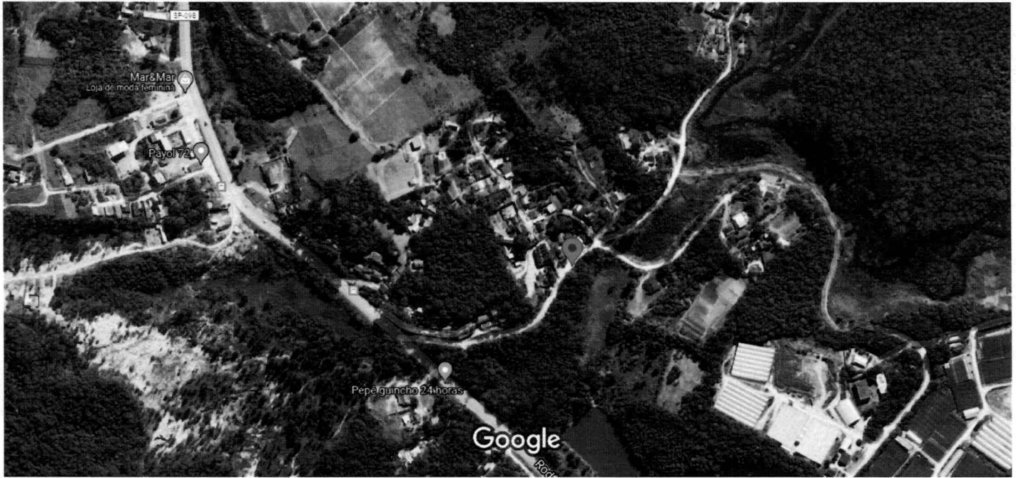
Imagens ©2021 CNES / Airbus, Maxar Technologies, Dados do mapa ©2021 100 m