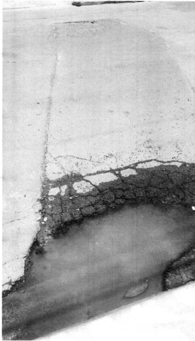
TAPA-BURACO EM FRENTE AO Nº. 313, NA RUA GABRIEL DANÚBIO, JD. AEROPORTO III.