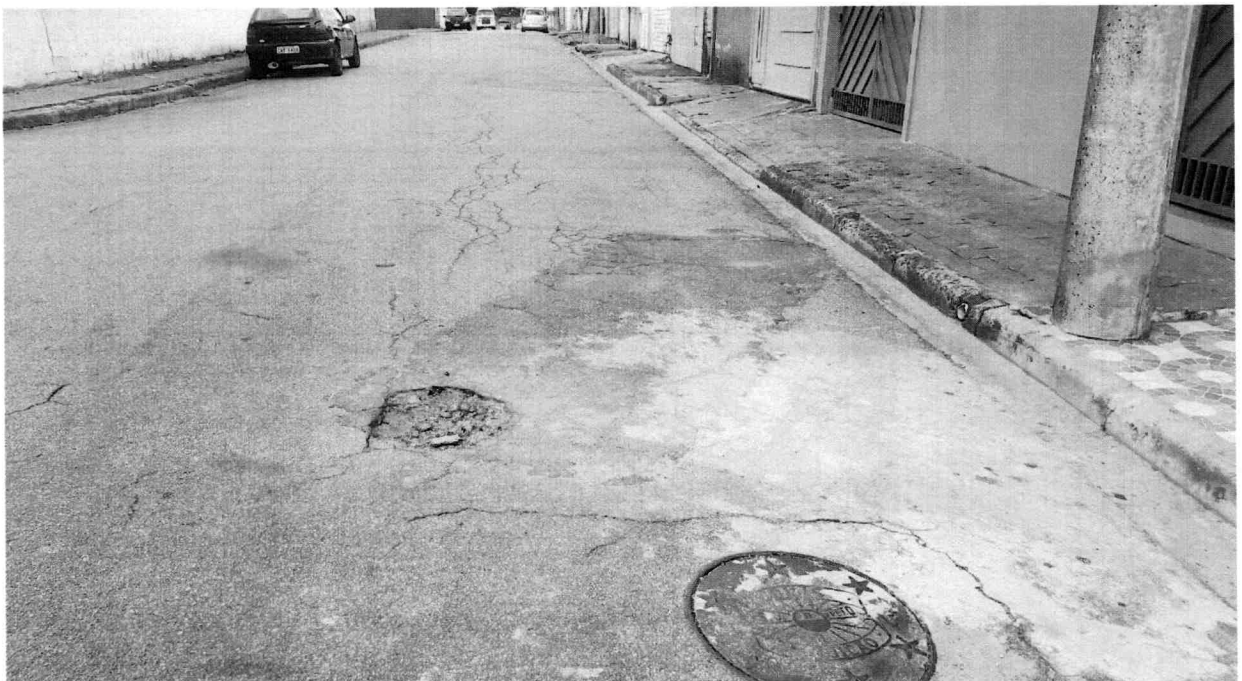
TAPA - BURACO NA RUA SILVESTRE E EM TODA SUA EXTENSÃO, CONJUNTO DO BOSQUE.