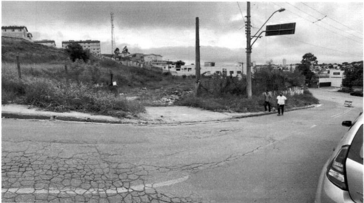
Rua Capitão Arcílio Rizzi, esquina com a Av. Álvaro Freitas Cezar de Souza