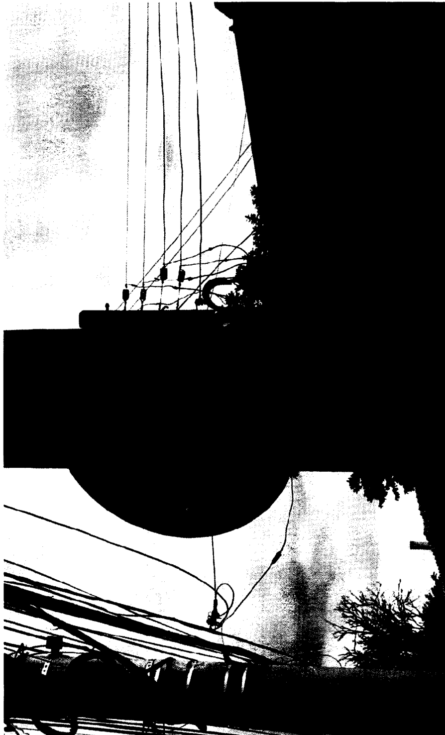
SUBSTITUIÇÃO DA PLACA DE TRÂNSITO INDICATIVA DE VELOCIDADE MÁXIMA, NA RUA BENEDITO DE CARVALHO FILHO, EM FRENTE AO N° 68, JARDIM AEROPORTO III.