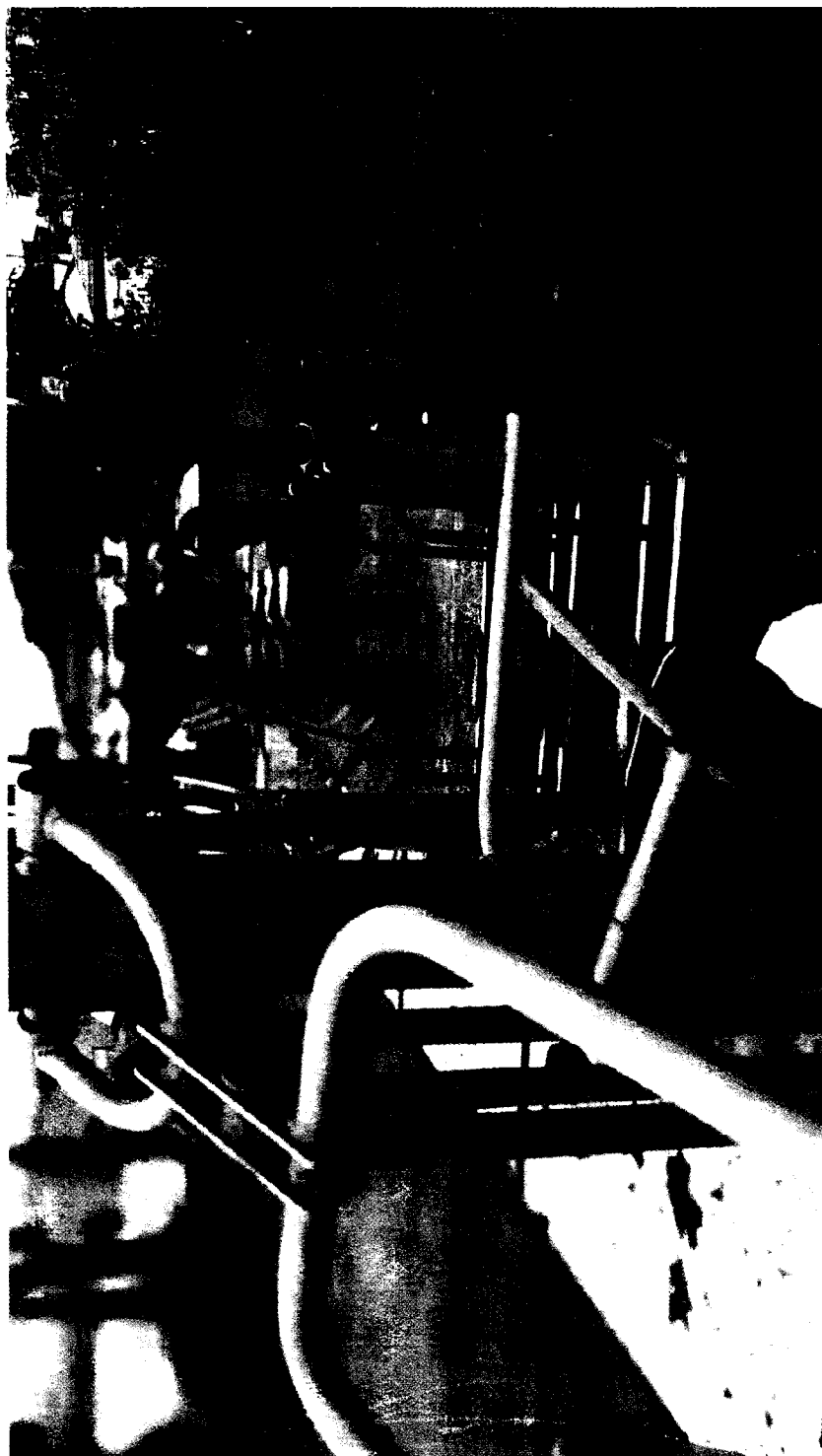
MANUTENÇÃO DOS APARELHOS DA ACADEMIA DA TERCEIRA IDADE (A.T. I) NA PRAÇA ZUMBI DOS PALMARES, LOCALIZADA NA RUA ANTÔNIO RODRIGUES ARZÃO, BRÁS CUBAS.