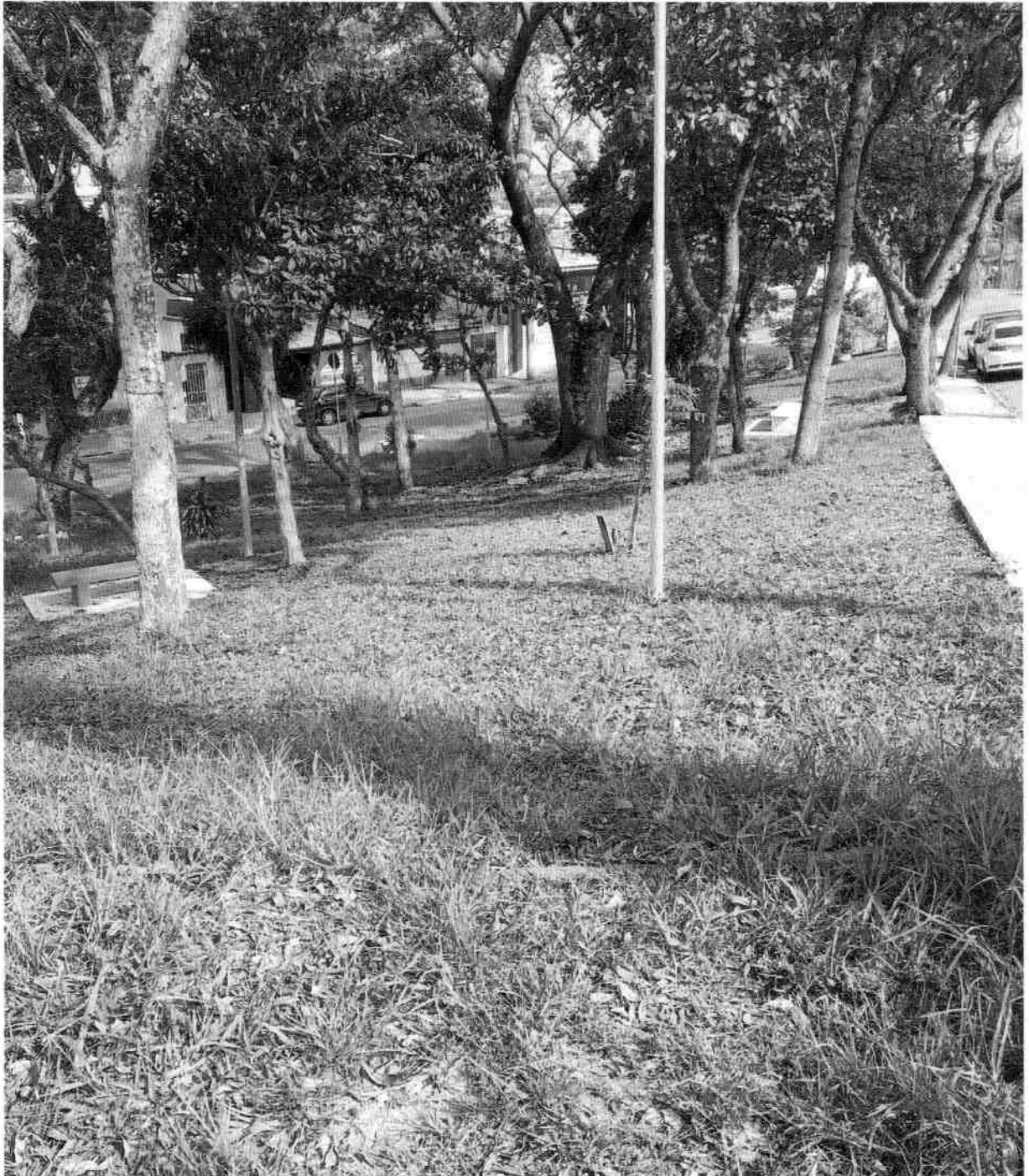
de INSTALAÇÃO DE UMA ACADEMIA DA TERCEIRA IDADE (A.T. I) NA PRAÇA JOSÉ DOMINGOS DA SILVA, SAGRADO CORAÇÃO DE MARIA.