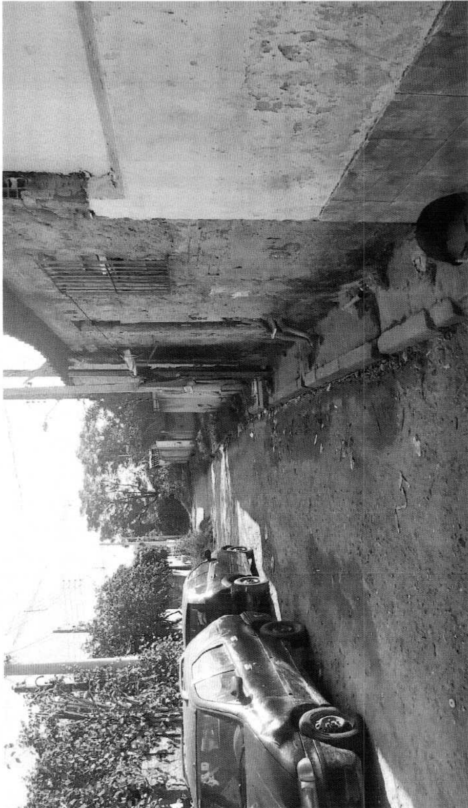
LIMPEZA E ROÇAGEM EM TODA EXTENSÃO DA TRAVESSA I, VILA ESTAÇÃO – MOGI DAS CRUZES.