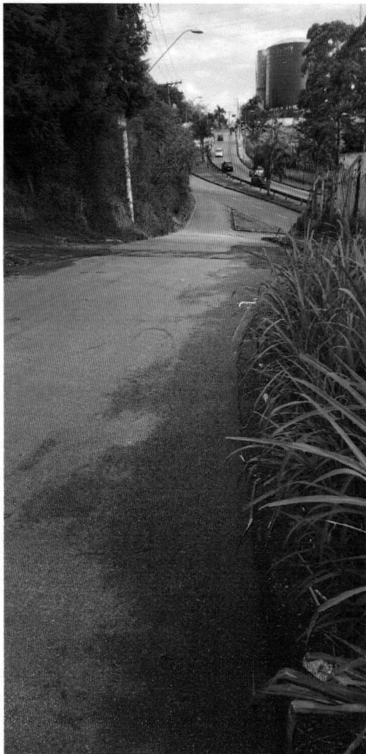
Acesso da perimetral