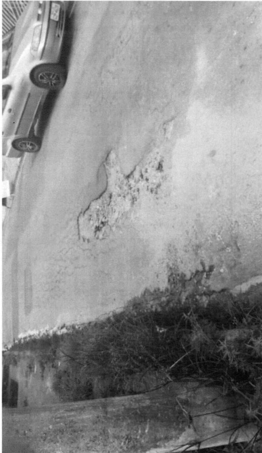
TAPA-BURACO EM TODA EXTENSÃO DA RUA NEWTON ALVES DOS ANJOS, VILA SÃO SEBASTIÃO.