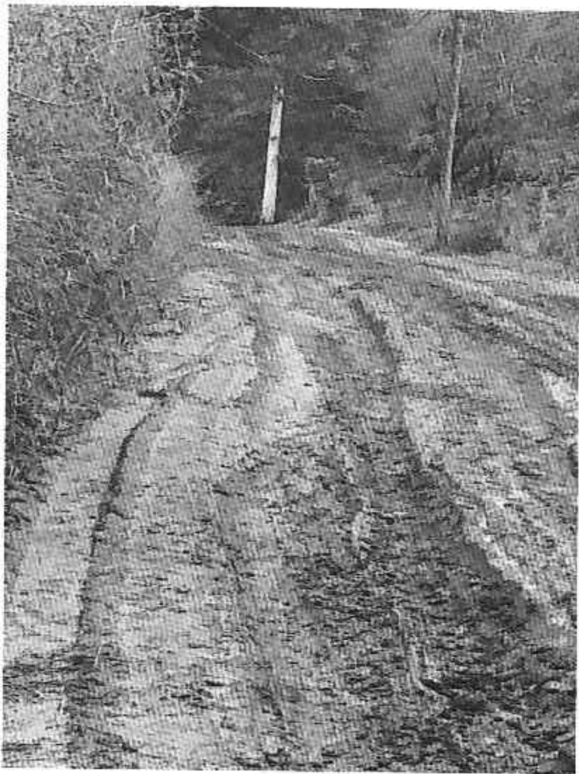
Nivelamento e cascalhamento ao longo da rua rikio suenaga - caputera