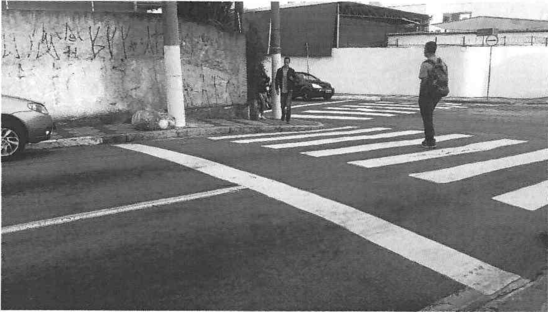
Rua Dom Antonio Candido de Alvarenga