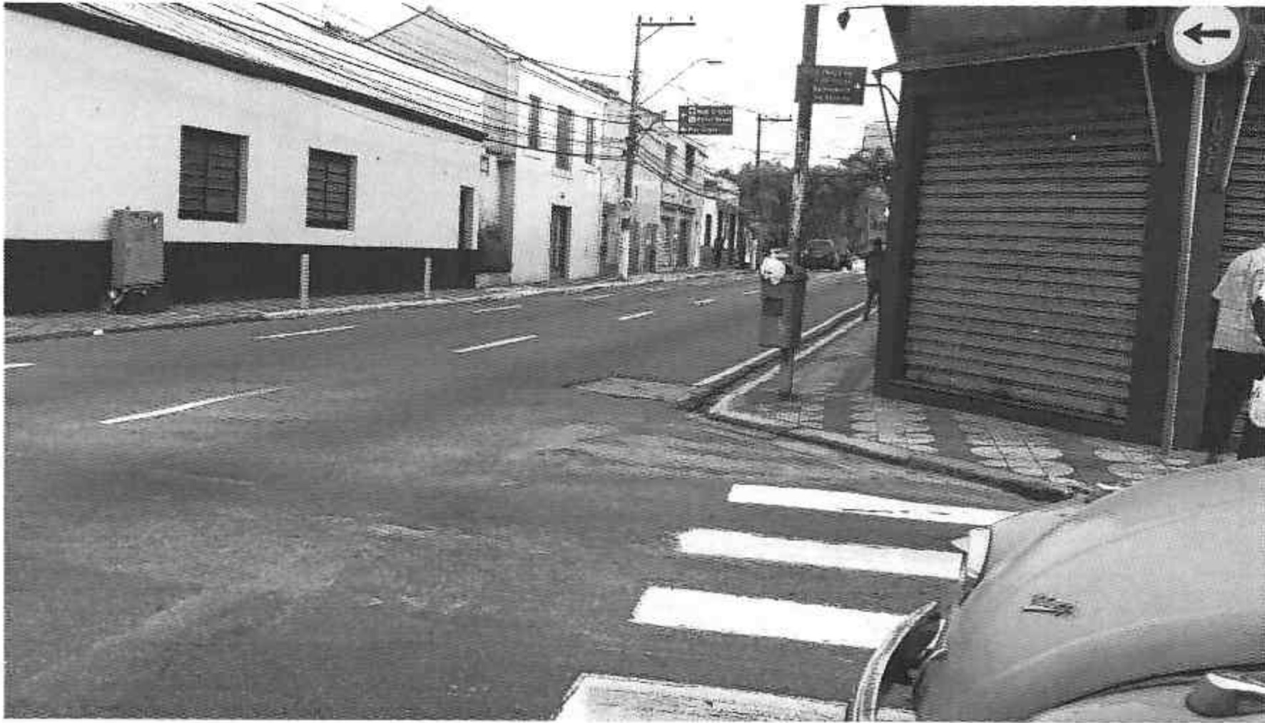
Rua Ricardo Vilela