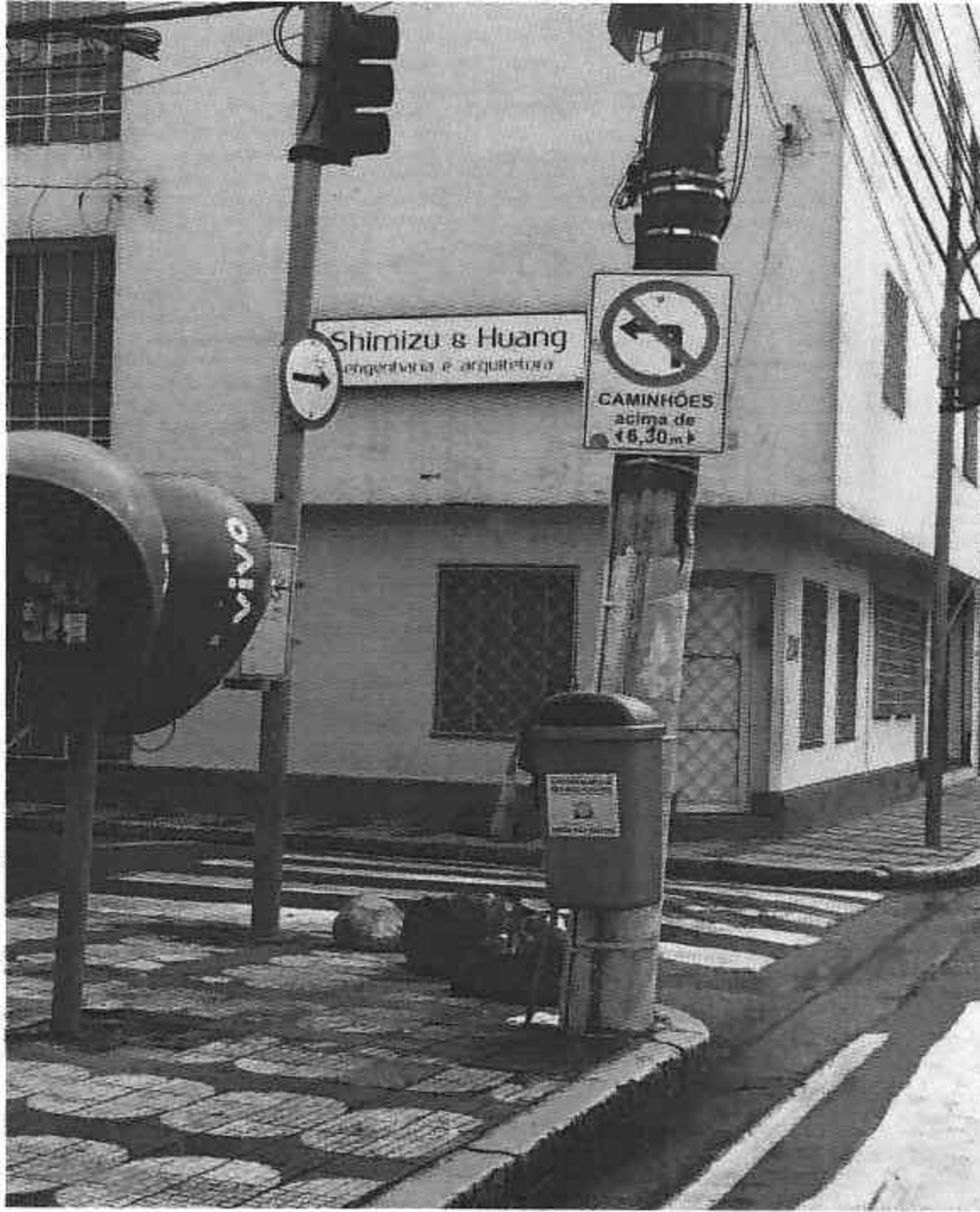
Rua Presidente Rodrigues Alves