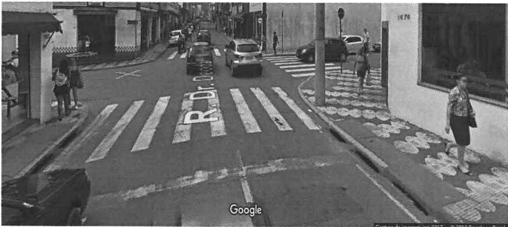
Rua Deodato Wertheimer