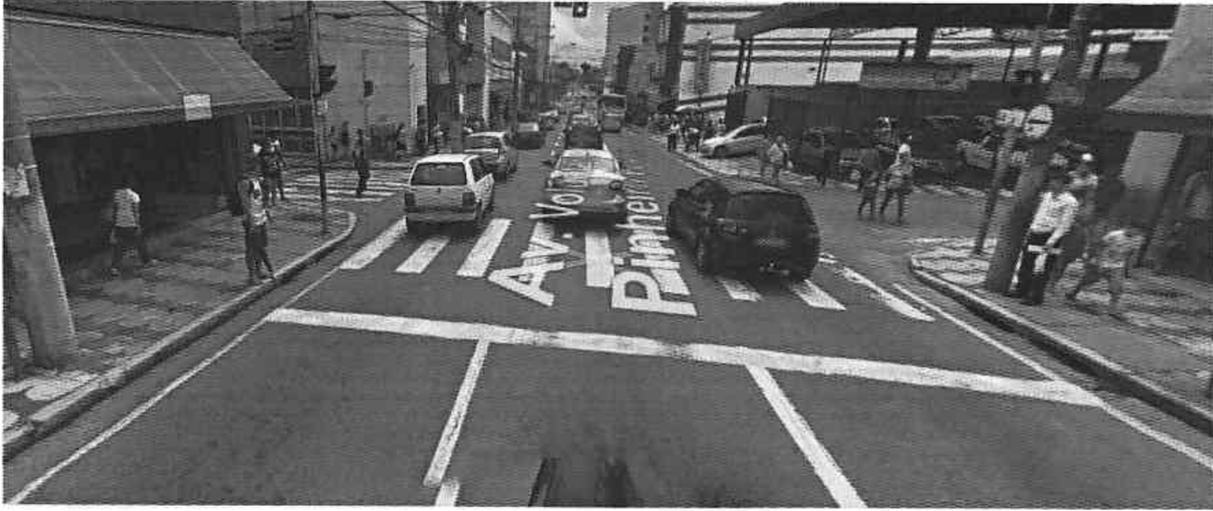
Av. Voluntario Pinheiro Franco