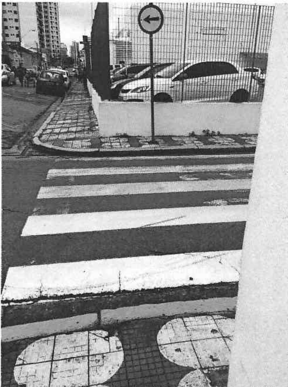
Rua Ricardo Vilela esquina com a Rua Padre João