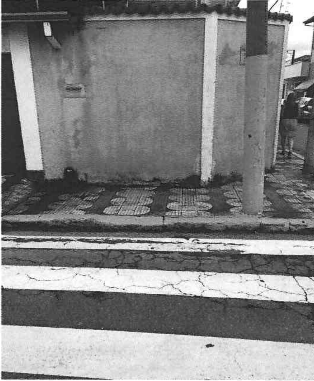
Rua Padre João