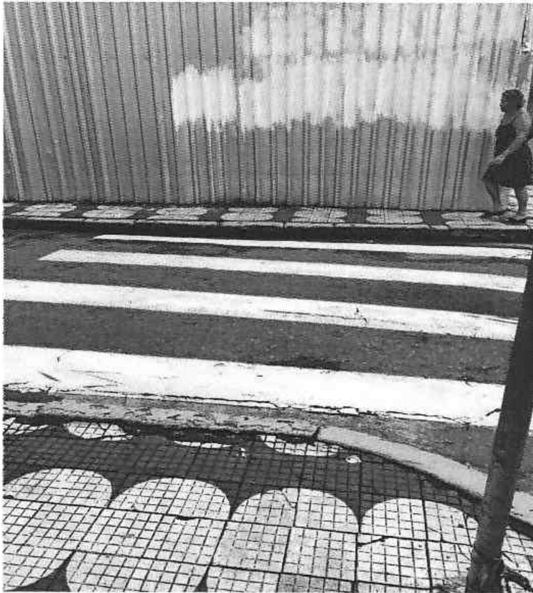
Rua Barão de Jaceguai