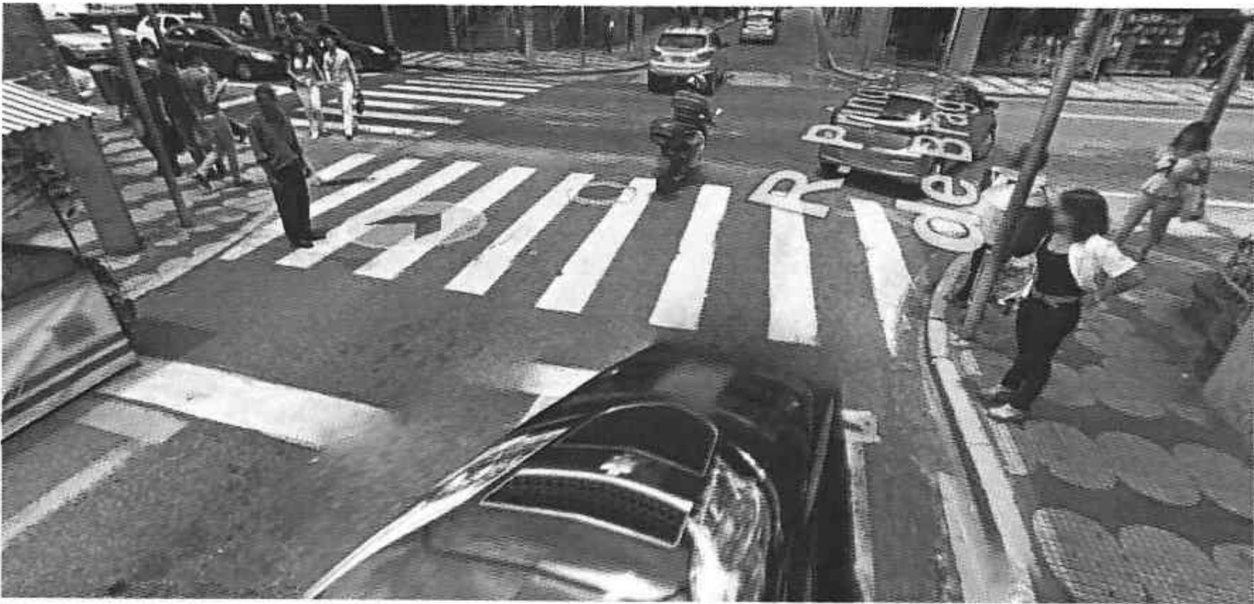
Av. Voluntario Pinheiro Franco esquina com Rua Princesa Isabel de Bragança