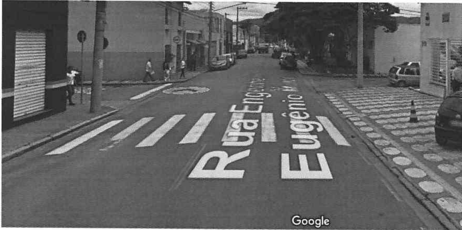
Rua Engenheiro Eugenio Mota