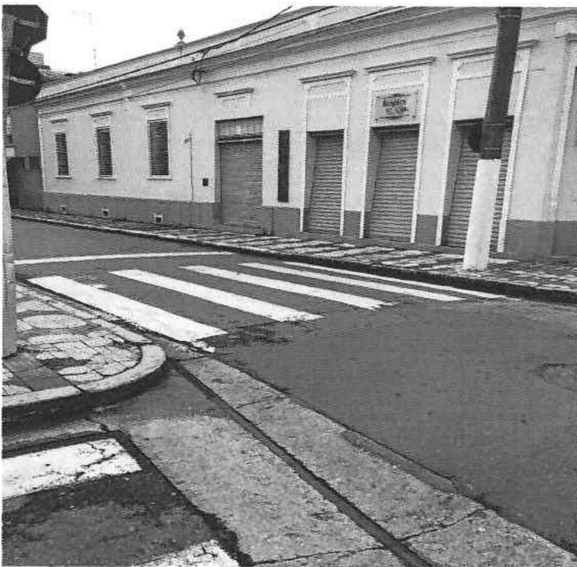
Rua Tenente Manoel Caetano