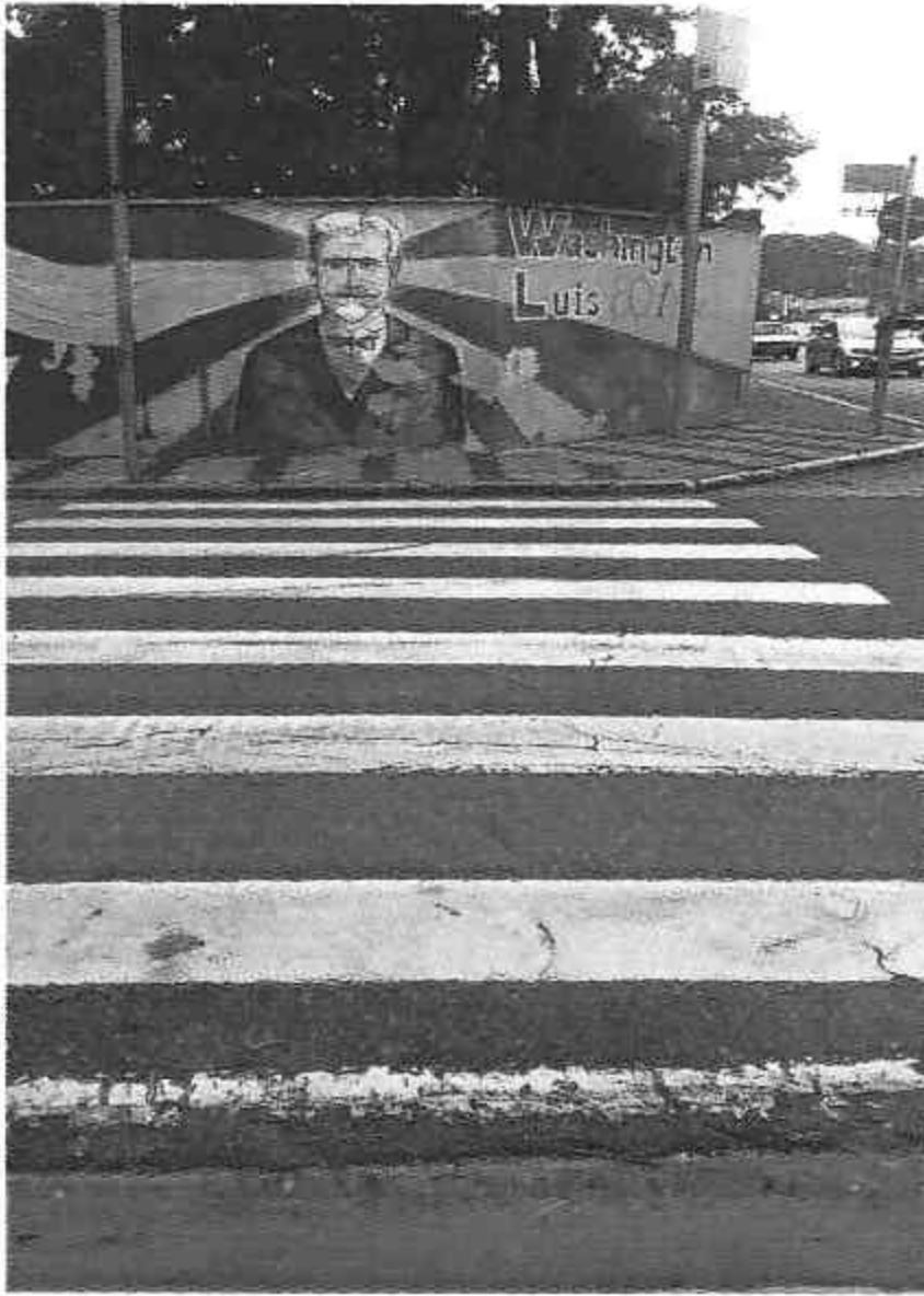
Rua Cel. Cardoso de Siqueira