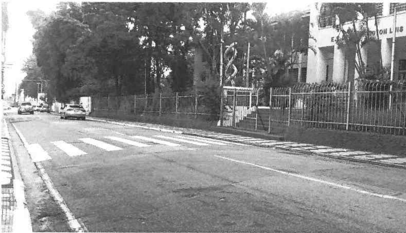
Rua Dom Antonio Candido de Alvarenga