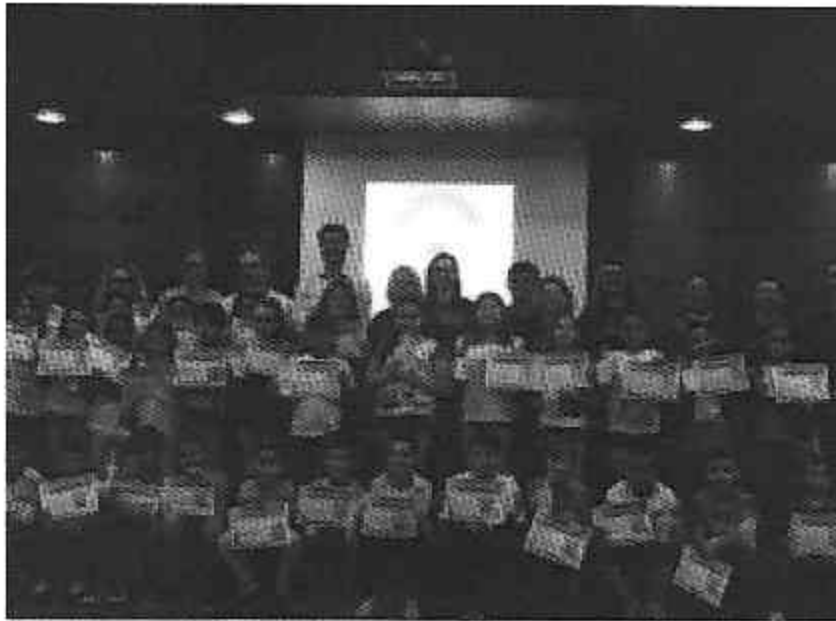
A entrega dos certificados aconteceu no auditório da PUC no ano passado

18/07/2018 às 22:00 - Atualizado em 18/07/2018 às 14:42 - por Da Redação